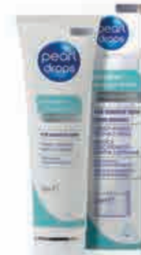
TAVOLA - PEARL DROPS LINEA SPECIALIST WHITE

Instant Natural White è il dentifricio per denti immediatamente e naturalmente più bianchi. L'innovativa formula con carbone attivo aiuta a rimuovere le impurità, previene la formazione di macchie e sbianca a lungo termine. Contiene sbiancanti ottici per un sorriso più brillante e lucido. La combinazione di questi due ingredienti chiave conferisce il caratteristico colore viola. Sensitive Natural White è il dentifricio per denti sensibili e delicatamente più bianchi in due settimane. La nuova formula al 92% con ingredienti di origine naturale, a bassa abrasività, combina il potere dell'argilla bianca e del bicarbonato di sodio per pulire a fondo, aiutare a rimuovere le macchie superficiali e sbiancare delicatamente i denti, senza danneggiare lo smalto. Tubo da 75 ml, in astuccio.